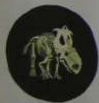
ВИД МОНЕТЫ НОЧЬЮ

Канада удивила мир, выпустив 25 тысяч миллионных монет. Их уникальность заключается в том, что с одной стороны монеты нанесены изображения денариуса, а с другой стороны - герб Канады. По местным традициям так и не удалось вбить.