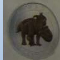
ВИД МОНЕТЫ ДНЕМ